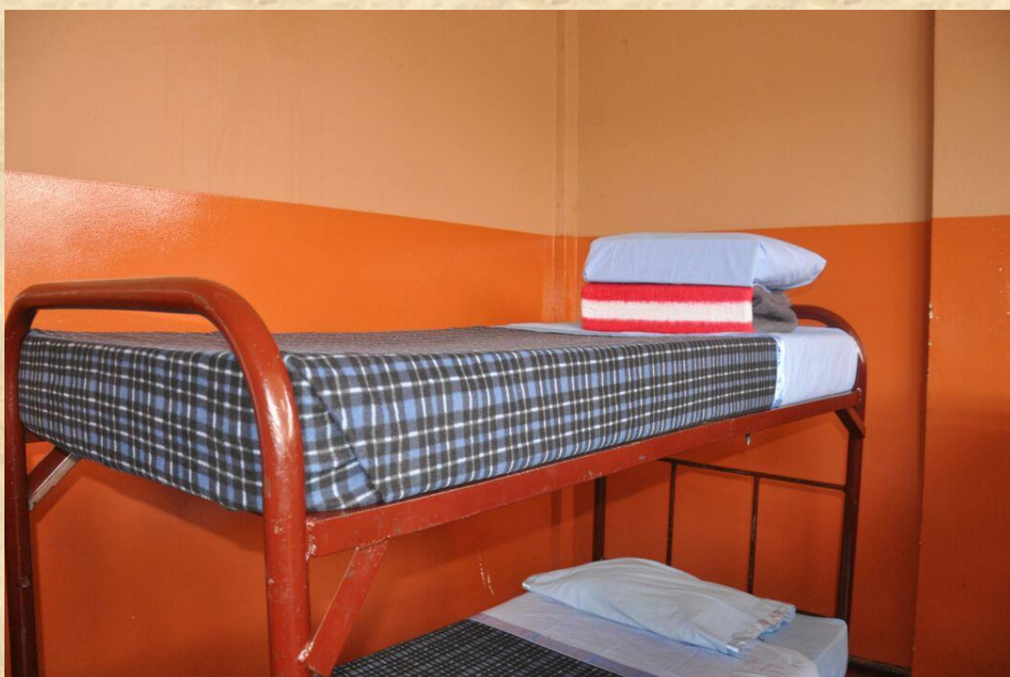
DORMITORIO DE CADETES