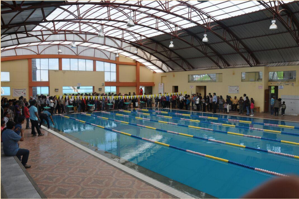
PADRES FAMILIA QUEDAN IMPRESIONADOS CON LA PISCINA SEMI OLIMPICA DEL COLEGIO